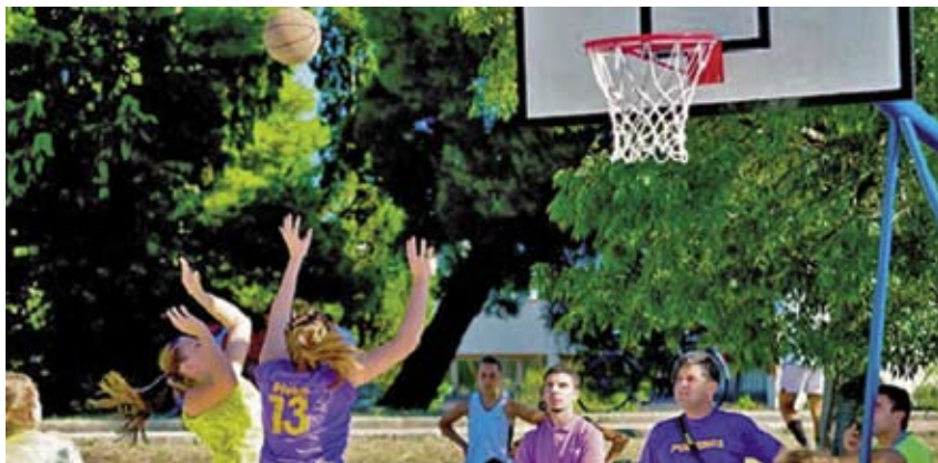
Slika 2: Igra na en koš je zelo nezahtevna z vidika pogojev igranja, igramo jo tudi na zunanjih igriščih ( http://igremladih.ba/naslovna/ ).

t. i. seniorje. Tekmovanja potekajo celo v starostni kategoriji od 75 do 79 let (For One Seniors Basketball Team, The Game Never Gets Old, 2012).