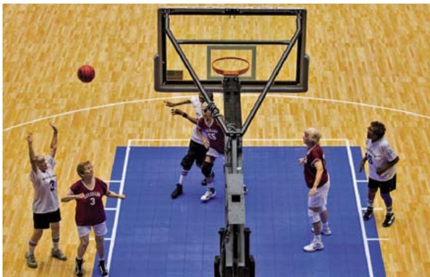
Slika 1: Tekmovalnja v igri 3 : 3 na en koš postajajo popularna tudi pri starejših ( http://www.npr.org/2013/07/31/207360747/for-one-seniors-basketball-team-the-game-never-gets-old ).

Prednost košarke (tudi pred drugimi igrami z žogo) je v tem, da je zelo nezahtevna z vidika pogojev, ki so potrebni za igranje. Igramo jo lahko tako v telovadnicah, kot tudi na zunanjih igriščih. Za igro zadostuje že en koš, ki je lahko tudi mobilni in sestavljiv. Postavimo ga lahko pravzaprav na katero koli ravno in trdo (betonsko ali asfaltno) površino primerne velikosti. Zunaj je to lahko parkirišče, ploščad, dvorišče ali pa ulica, ki je zaprta za promet. Košarko lahko igra tudi manjše število igralcev. Za igro 1:1 potrebujemo poleg koša in žoge samo še enega soigralca, s katerim (proti kateremu) bomo igrali, in razmeroma majhno igralno površino. Čeprav je taktično siromašnejša, pa igra 1:1 vsebuje večino tehničnih elementov igre 5:5 na dva koša. Še bolj tehnično in taktično bogata je igra 2:2, medtem ko igra 3:3 vsebuje že veliko večino igralnih značilnosti najbolj poznane in uveljavljene različice košarke, tj. igre 5:5 na dva koša. Vse bolj popularna različica igre 3:3 na en koš postaja že omenjena ulična košarka, ki predstavlja sodobno, lahko bi rekli urbano obliko te igre, ki združuje tako športno-tekmovalni vidik, kot tudi druženje in zabavo mladih. Igra na en koš je glede na svoje igralne značilnosti zelo primerna tudi za starejšo populacijo in vse bolj pogosto se pojavlja tudi v tekmovalni obliki. V ZDA so zelo priljubljeni turnirji v igri 3:3 za